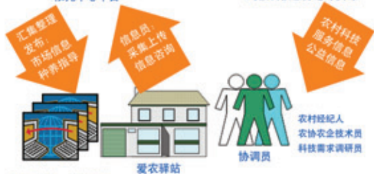
对接科技服务港等资源